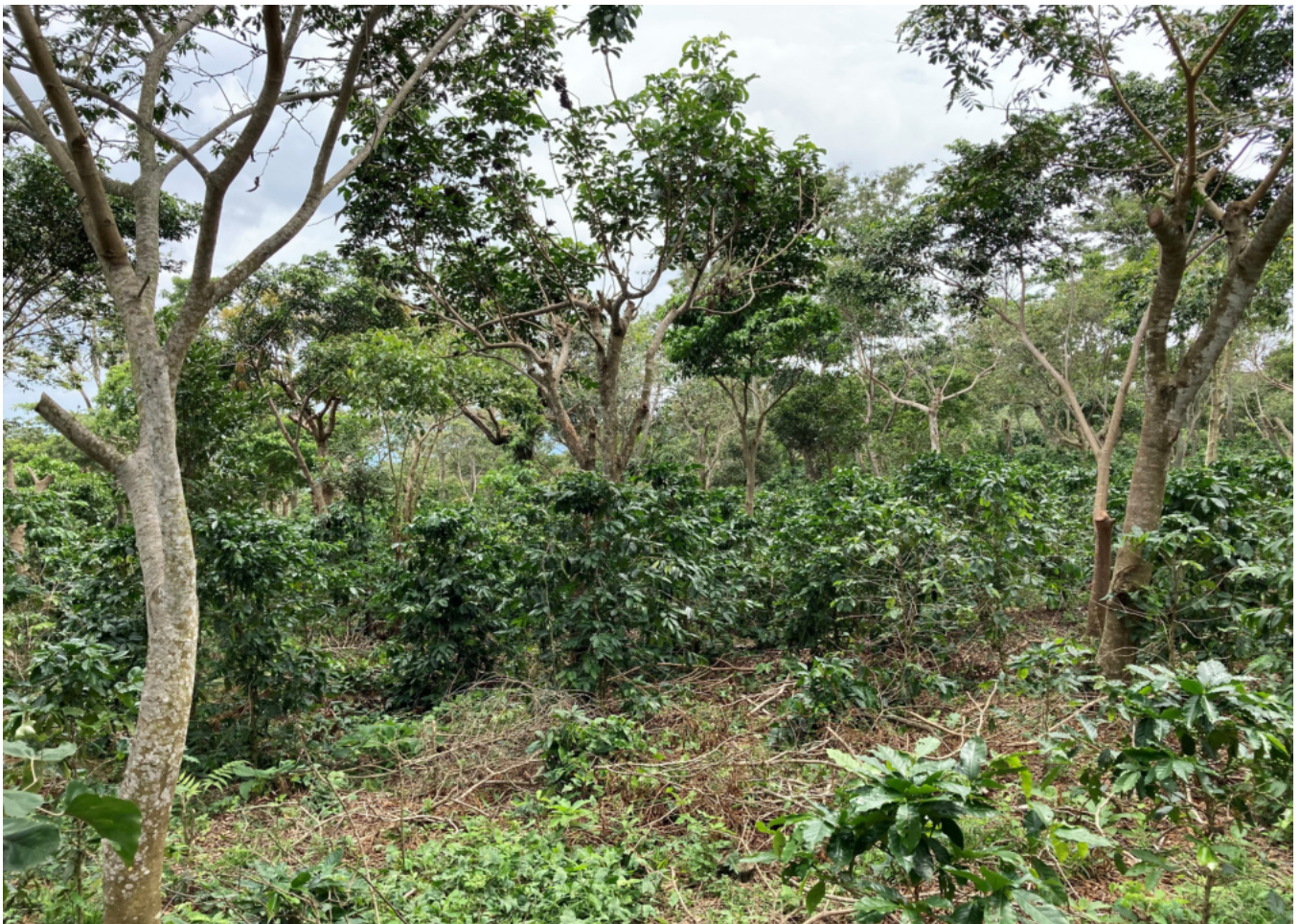
Abb. 5: Kaffeepflanzen und Schattenbäume auf einer der Projektflächen in El Salvador

Agroforstsysteme bringen vielen ökologische Vorteile. Die Anforderung, für die Kaffeepflanzen eine kontinuierliche Beschattung sicherzustellen, schließt zum Beispiel ökologisch schädliche Kahlschläge aus. Die finalen Bewertungen zu diesem Investment finden Sie nach Veröffentlichung in der vollständigen Fallstudie.