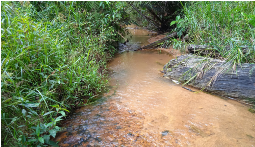
Abb. 4: Fluss im FSF-Projektgebiet