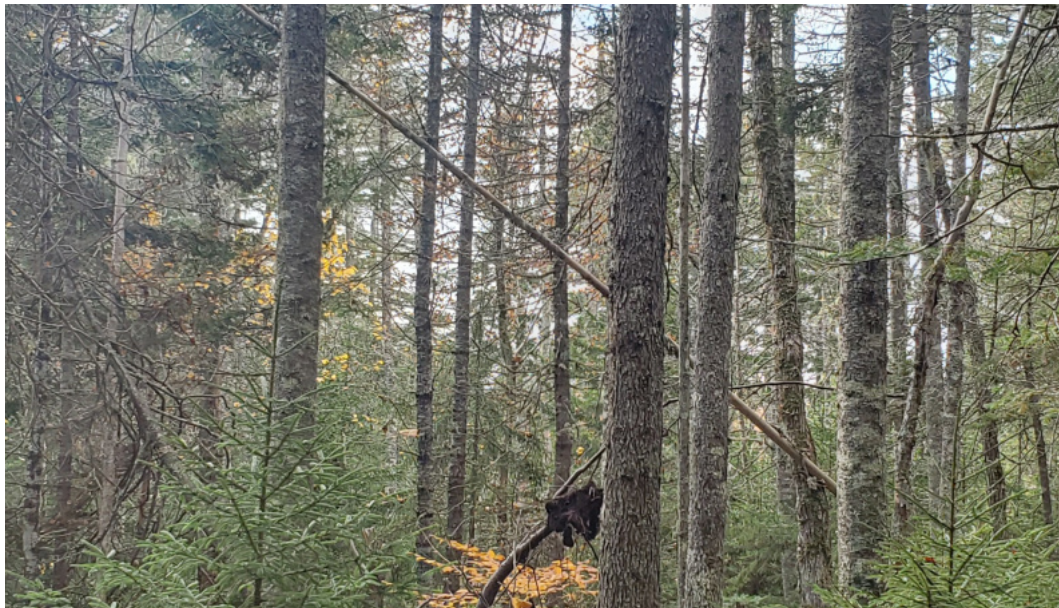
Abb. 3: Verschiedene Baumarten mit unterschiedlicher Altersstruktur auf einer der BWI-Projektflächen