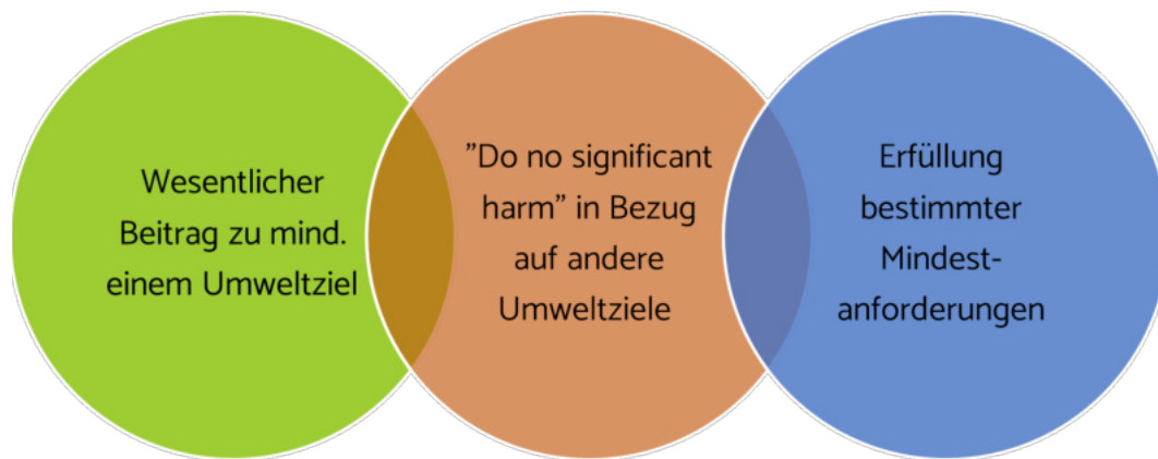
Abb. 6: Anforderungen der EU-Taxonomie an nachhaltige Wirtschaftsaktivitäten

Die Nachhaltigkeitsbewertungen der EU-Taxonomie orientieren sich an sechs Umweltzielen: