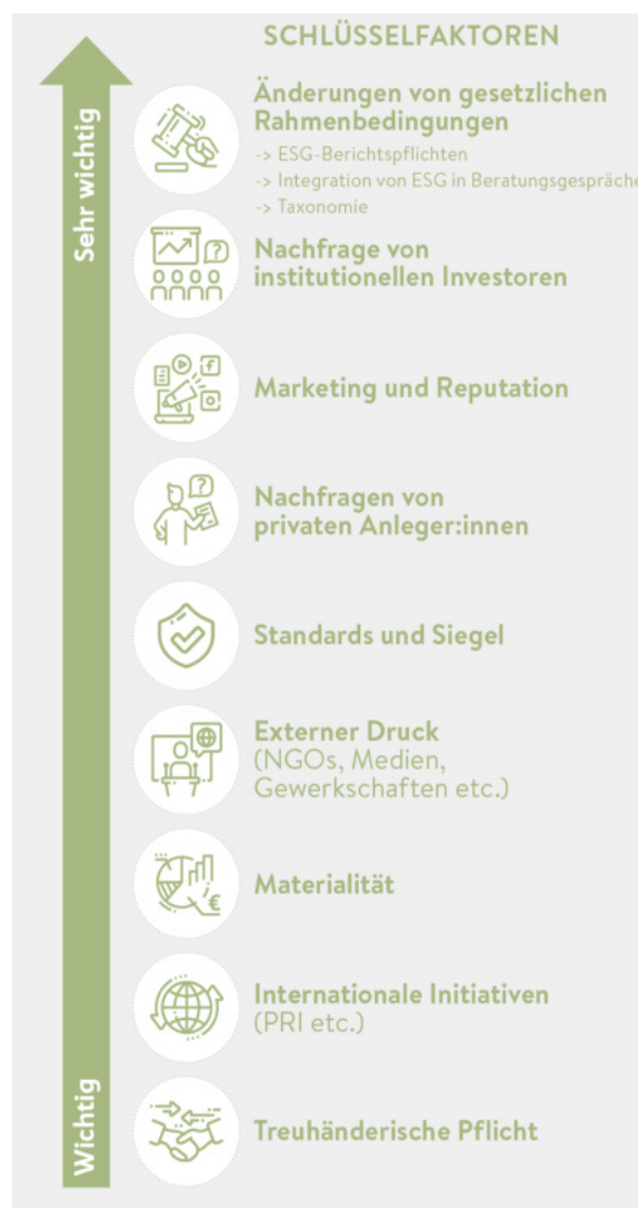
Abb.1: Schlüsselfaktoren für die Entwicklung des nachhaltigen Anlagemarktes, sortiert nach Relevanz

Gesetzliche Rahmenbedingungen sind für die Entwicklung von nachhaltigen Geldanlagen grundlegend. Dazu gehören ESG-Berichtspflichten (Environmental, Social, Governance), die verpflichtende Behandlung von ESG-Kriterien in Beratungsgesprächen sowie die EU-Taxonomie. Auch Marketing und Reputation gehören zu den Schlüsselfaktoren am Markt. Externer Druck, zum Beispiel durch Nichtregierungsorganisationen (NRO), landete im FNG-Ranking der wichtigsten Marktfaktoren 3 immerhin auf Platz 6 (siehe Abb. 1).