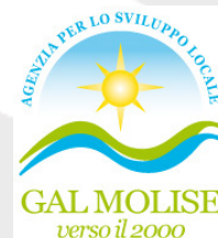
GAL MOLISE VERSO IL 2000 (ITALY)