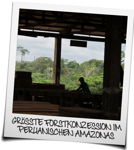
GRÖSSTE FORSTKONZESSION IM PERUANISCHEN AMAZONAS